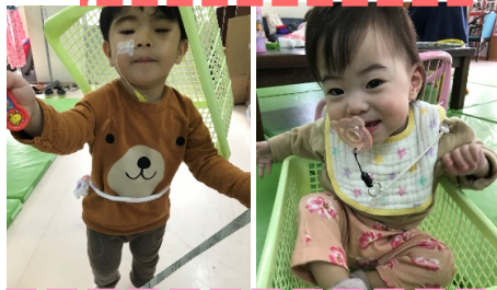
箱被る息子(笑)と箱入り娘♡♡