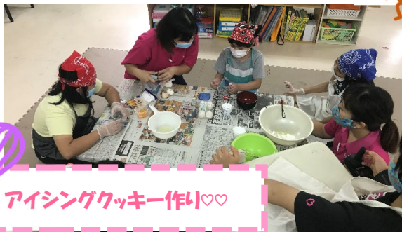
アイシングクッキー作り♡